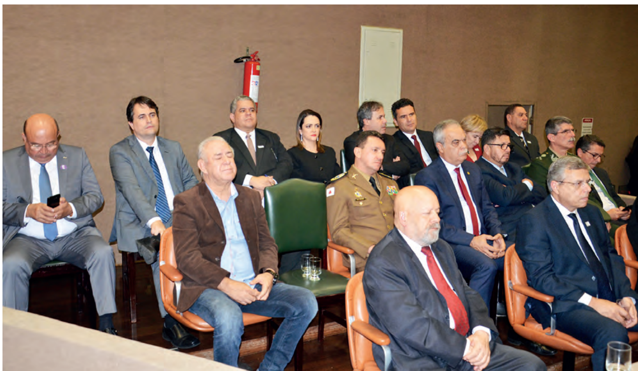
Defensora-geral compõe o dispositivo de autoridades