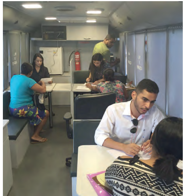
Defensores públicos durante atendimento e orientações