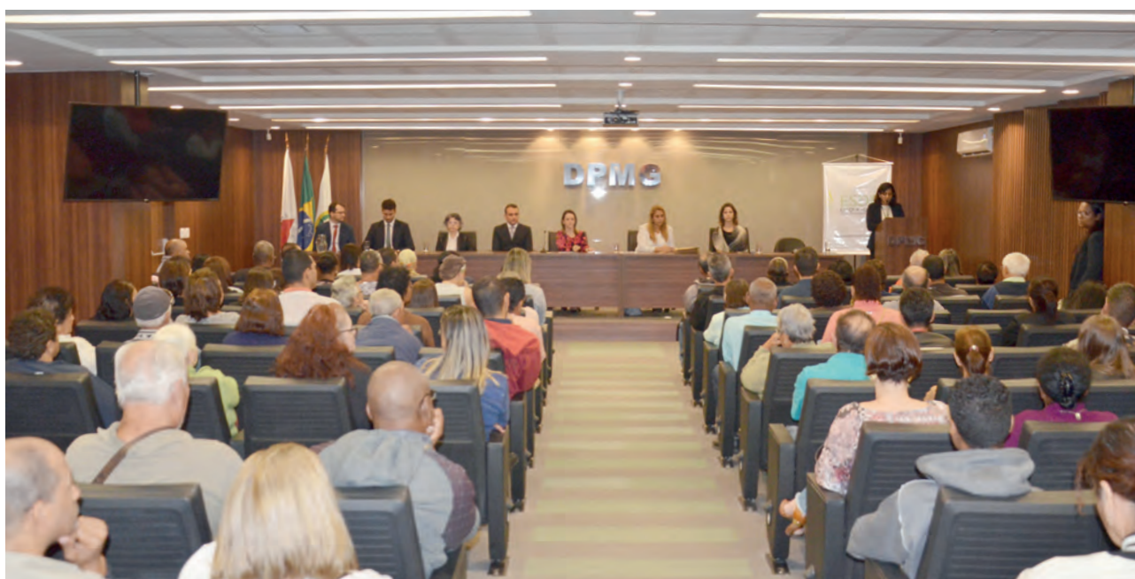
Solenidade levou ao auditório da Defensoria Pública dezenas de assistidos com ações de usucapião em fase final