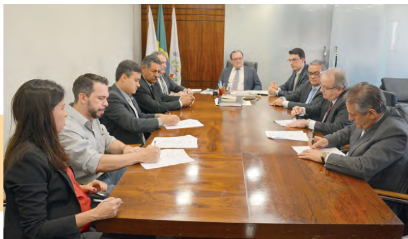
Órgãos do Executivo Estadual e instituições do sistema de Justiça firmam parceria para atuação em rede das questões de saúde