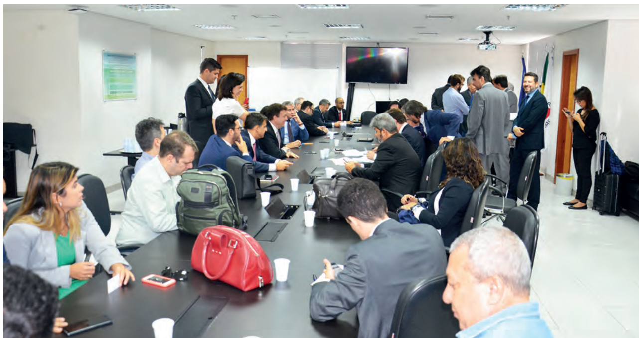
Assinaram o acordo: as Defensorias Públicas dos estados de Minas Gerais (DPMG) e Espírito Santo (DPES) e da União (DPU), os Ministérios Públicos dos estados (MPMG e MPES) e o Ministério Público Federal (MPF)

Clique aqui para mais informações sobre o acordo.