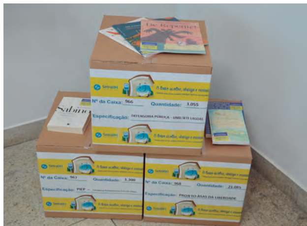
Foram entregues, no total, mais de 25 mil exemplares que serão usados nas unidades prisionais do Estado