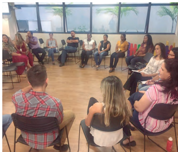
A gincana envolveu funcionários do Atendimento da Capital em questionário sobre matérias de Direito

O projeto foi proposto pelos próprios funcionários, para que pudessem firmar os conhecimentos obtidos no projeto Bate Papo Legal e nos Manuais de Dicas de Atendimento, idealizados e criados pela Coordenação do Atendimento. O projeto será encerrado com entrega de certificados no dia 30 de junho, quando será anunciada a equipe campeã.