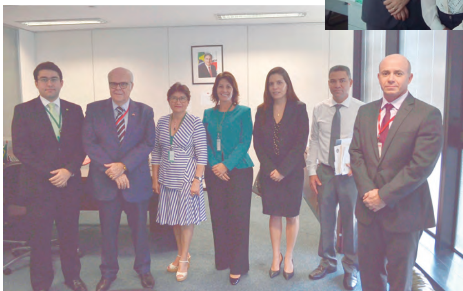
Encontro debateu temas referentes ao sistema penitenciário da comarca de Nova Lima