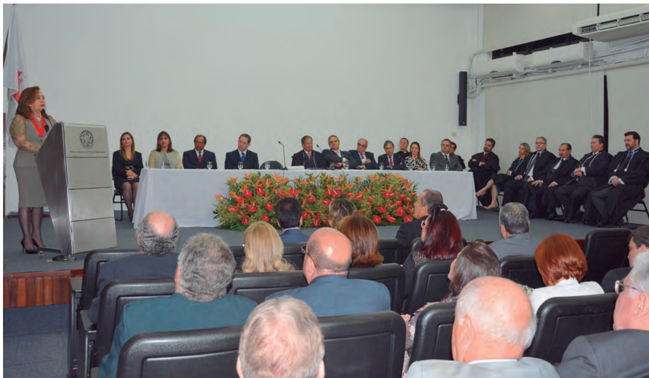
Mesa diretora dos trabalhos da outorga da medalha “Desembargador Vaz de Mello”