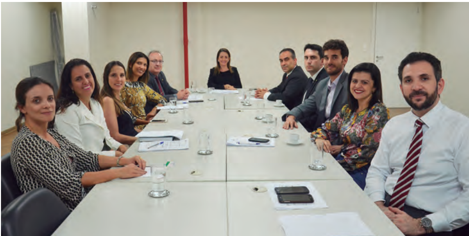
Defensores públicos da Administração Superior da DPMG e da diretoria da Associação reunidos

Outras reuniões serão realizadas, como forma de construção de entendimentos e propostas em benefício da Instituição e da classe.