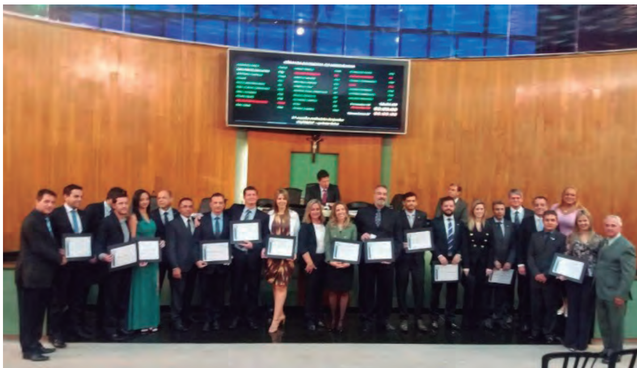
Defensores públicos tiveram o trabalho reconhecido pela Câmara Municipal de Uberlândia