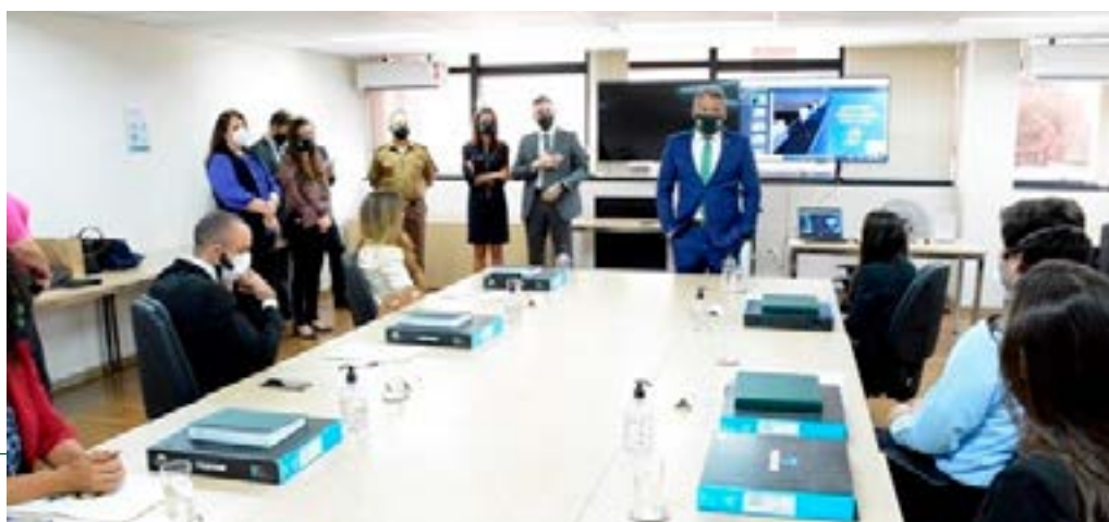
Abertura da capacitação foi feita pelo defensor-geral, Gério Patrocínio Soares, que deu as boas-vindas aos seis novos membros da Casa e apresentou a equipe da Defensoria-Geral. Participam do 8º Curso de Orientação e Preparação as defensoras e defensores, aprovados e empossados, da terceira turma do VIII Concurso