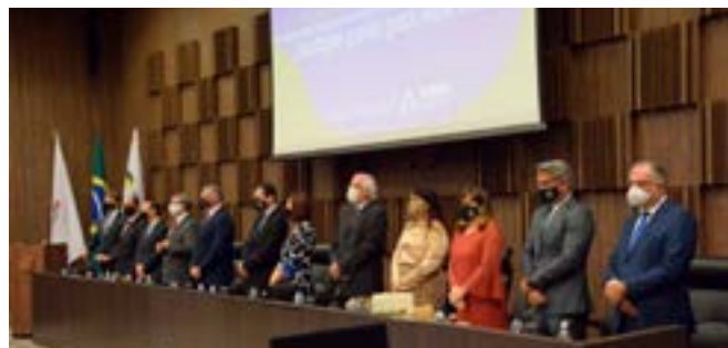
Defensor-geral (2ª posição, à direita) na mesa de honra