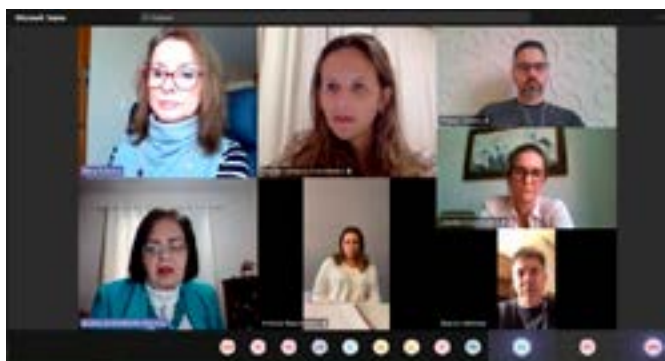
Reunião foi virtual, realizada via Teams, com mediadoras e alunos (as)

Durante o período do curso, que será realizado virtualmente entre 16 de agosto e 16 de novembro, os alunos terão acesso a videoaulas, textos de leitura selecionados e poderão interagir nos fóruns de discussão e debates livres. Haverá também, em cada módulo, uma hora de encontro síncrono.