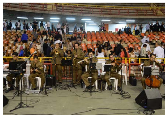
Banda da Polícia Militar, que executou a marcha nupcial para a entrada dos noivos