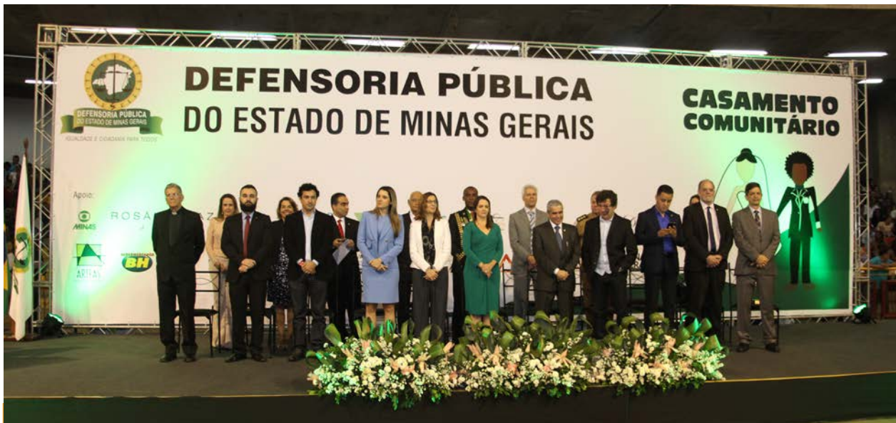
Dispositivo de autoridades