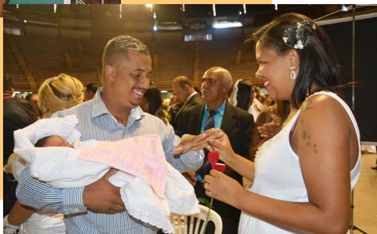
Troca de alianças

Os noivos trocaram alianças ao som da música "Na estrada", sob as vozes da dupla, também parceira da iniciativa.