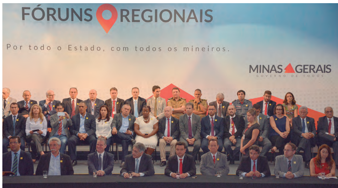
Dispositivo de autoridades durante a solenidade de posse dos membros do Colegiado Executivo dos Fóruns Regionais do Governo

Na solenidade, o governador do Estado, Fernando Pimentel deu posse a 160 prefeitos e 160 vereadores, que integram o colegiado, representando os 853 municípios mineiros, para um mandato de dois anos.