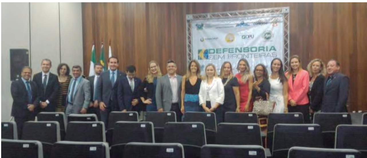
A abertura dos trabalhos foi realizada na Escola de Magistratura do Rio Grande do Norte