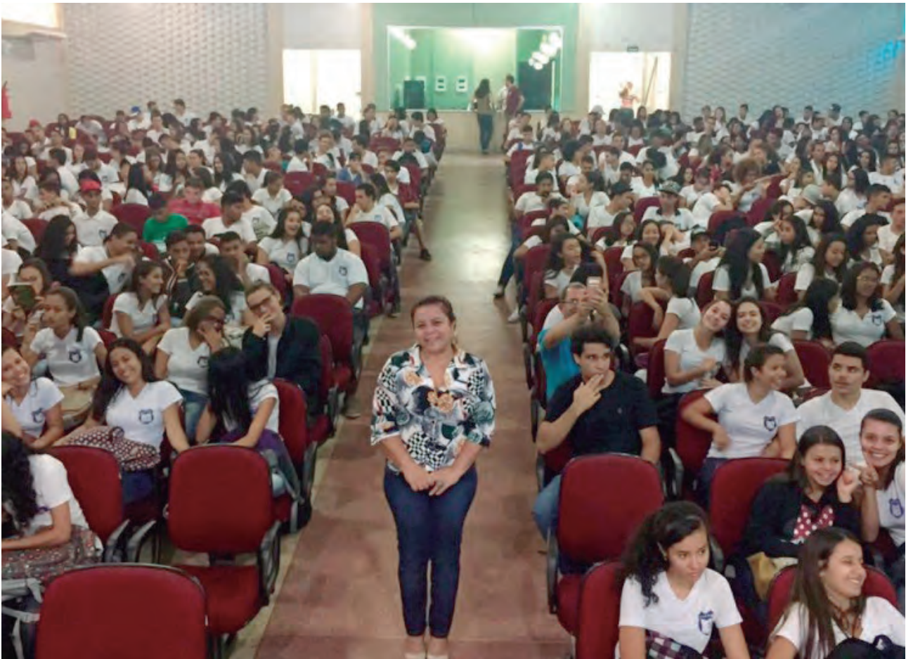
Palestra para alunos do ensino médio da escola estadual Professor Plínio Ribeiro