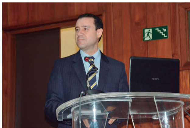
Ministro Nefi Cordeiro