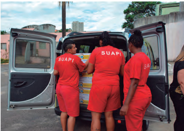
Após a doação, os dicionários foram entregues na unidade penitenciária

“Um gesto de proximidade. É a lembrança de alguém que está em cumprimento de pena”, resumiu o