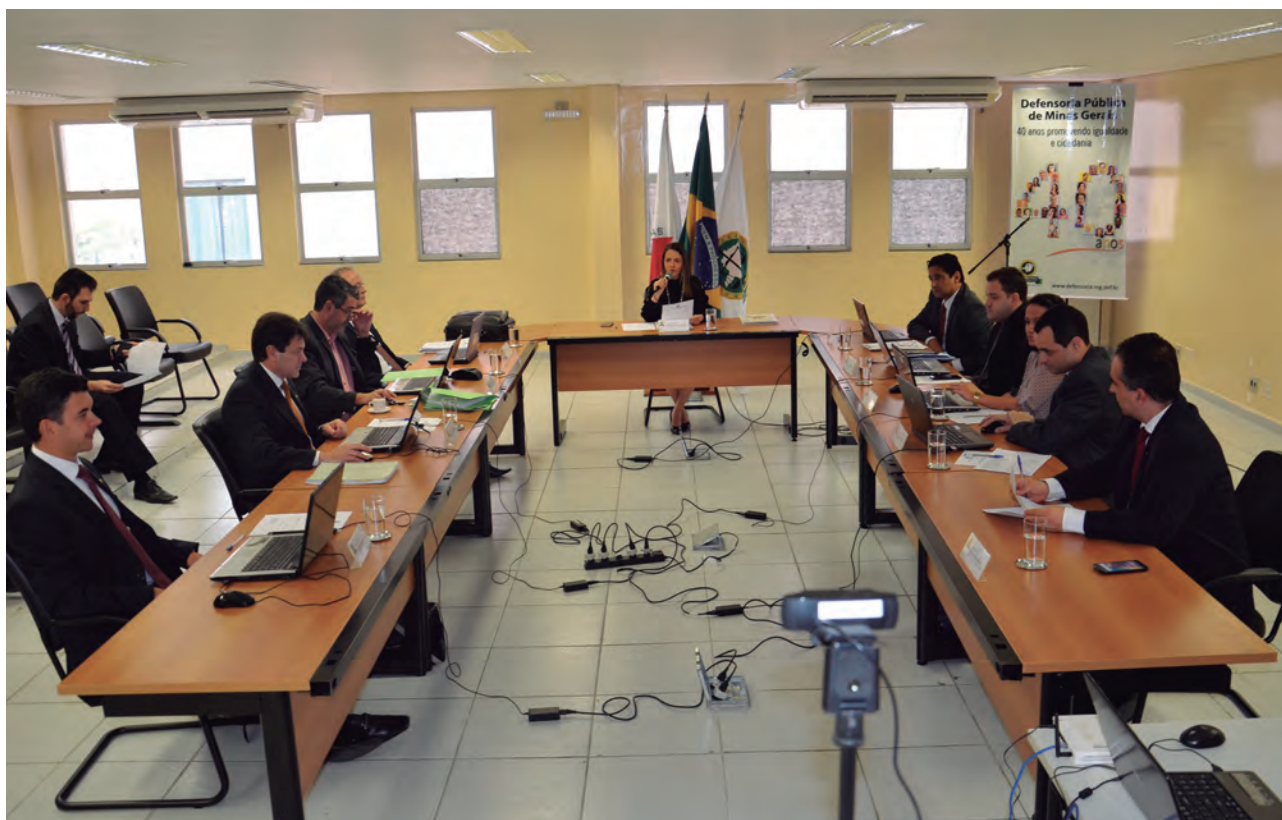
Conselheiros da DPMG durante a 8ª reunião ordinária de 2016, em Governador Valadares