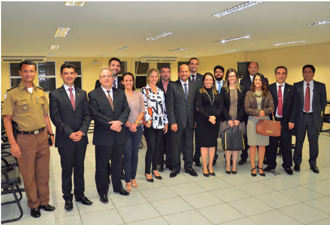
Presentes na sessão: defensora-geral e presidente do CS, demais membros do Conselho Superior, defensores públicos, e o chefe da Assessoria Militar da DPMG

Governador Valadares sedia a 2ª sessão itinerante do Conselho Superior da Defensoria Pública