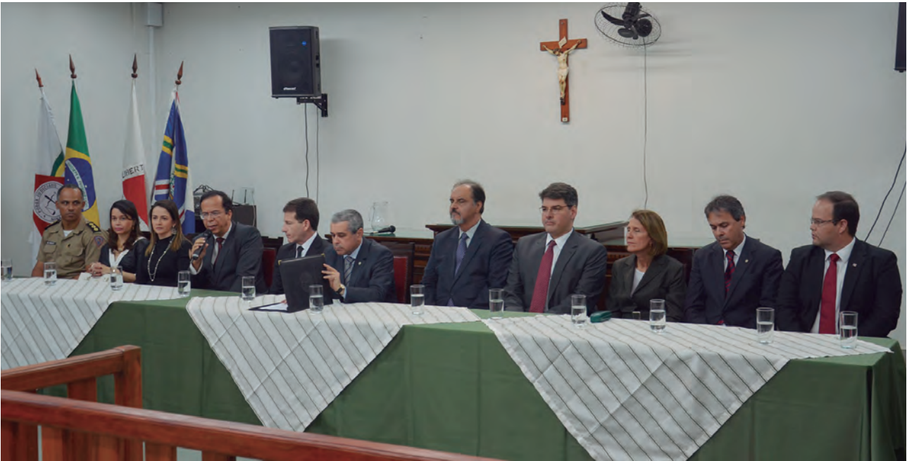
Defensora-geral, Christiane Malard (3ª posição, à esquerda), compõe a mesa de honra da cerimônia

Ainda no dia 29 de agosto, a defensora pública-geral do Estado, Christiane Neves Procópio Malard, representou a Instituição na solenidade para marcar a conclusão da implantação do Sistema Eletrônico de Execução Unificada (Seeu) na comarca de Governador Valadares, escolhida como piloto para implantação nacional do sistema. Durante a cerimônia, o presidente do Tribunal de Justiça de Minas Gerais, desembargador Herbert Carneiro, anunciou que o Seeu é agora uma política pública do Tribunal e será aplicada em todas as comarcas.