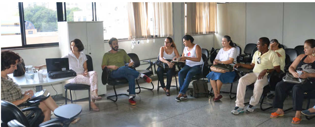
A roda de conversa integrou a programação da Semana Nacional da Luta pela Moradia, com eventos em diversos estados

A Roda de Conversa integra uma série de eventos que a Defensoria Pública preparou para Comemorar a Semana Nacional da Luta pela Moradia, com eventos em diversos estados, com o objetivo de colocar o Direito à Moradia como política pública, salientando a importância deste direito no contexto dos direitos humanos.