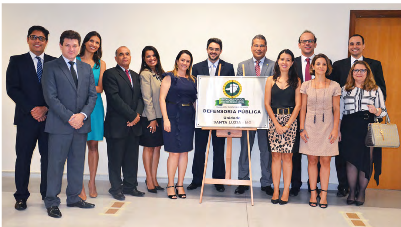
Defensores públicos presentes na solenidade de inauguração da unidade de Santa Luzia, na Região Metropolitana de BH