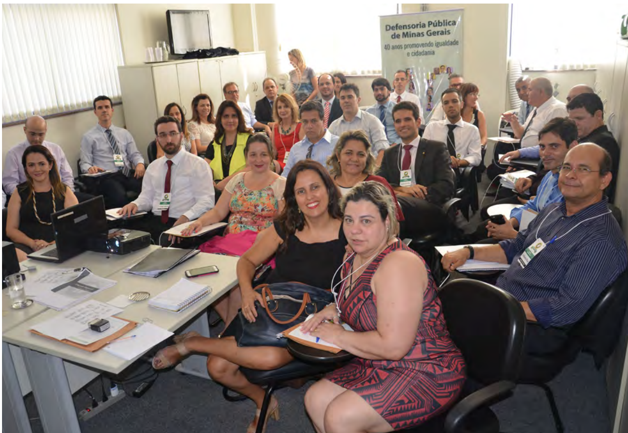
DPG e Coordenadores presentes no evento

O II Encontro de Coordenadores Regionais continua dia 15, integralmente dedicado ao planejamento estratégico.