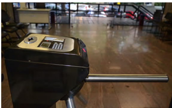
Em fase de instalação, catracas de acesso por meio de crachás e biométrico e câmeras em todos os andares das duas unidades

Ao final da instalação dos equipamentos, será realizada, inicialmente, a capacitação dos funcionários responsáveis pelo manuseio destes. Em seguida, a Defensoria Pública irá desenvolver campanha educativa, voltada para defensores públicos, servidores e colaboradores, com o intuito de conscientizar sobre a necessidade de procedimentos que contribuam, não só para a segurança patrimonial, mas também, pessoal.