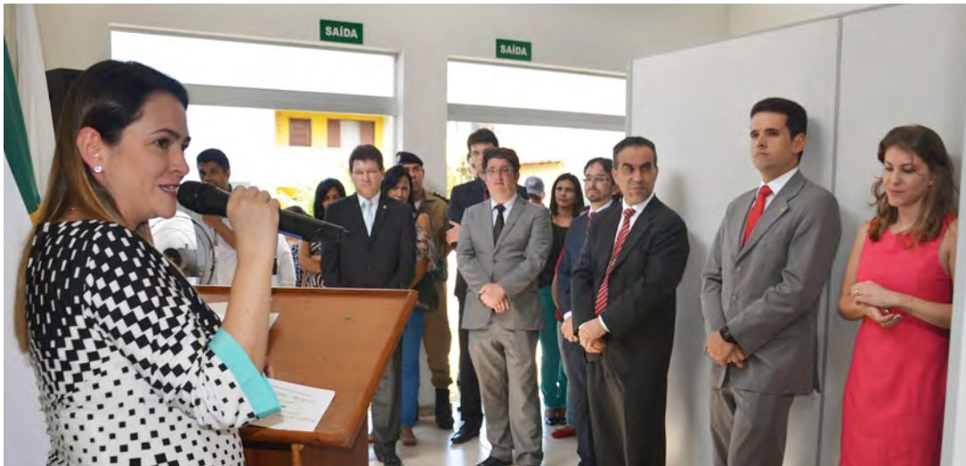
Defensora pública-geral, Christiane Malard, fala a os presentes

“Prefeitura Municipal, Tribunal de Justiça, Poder Legislativo Estadual, Câmara Municipal, além do Ministério Público, Ordem dos Advogados, Polícias Militar e Civil, e Corpo de Bombeiros. Somos diversas instituições que trabalham com o propósito único de oferecer um serviço público de qualidade à população”, afirmou.