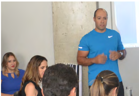
Exercícios de alongamento