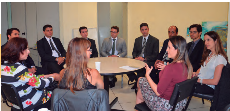
Reunião com os defensores da Regional Alto Rio Pardo, em Poços de Caldas