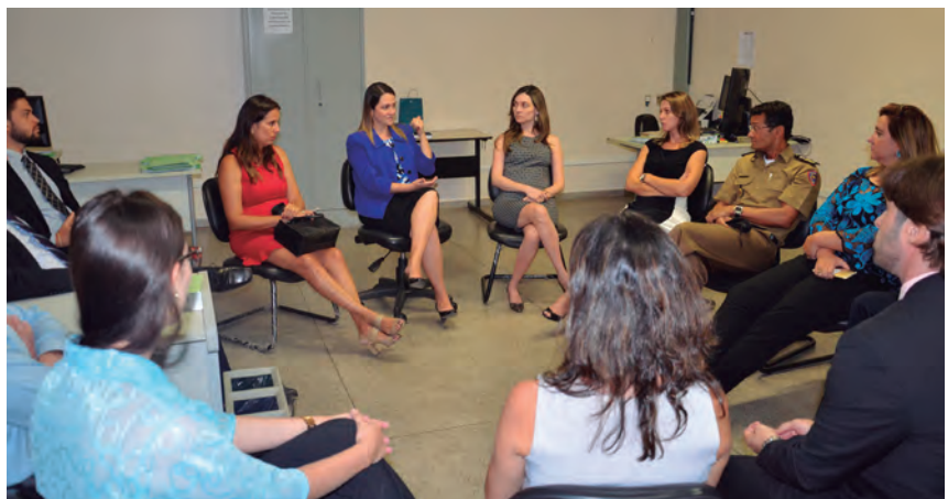
Após o encontro, a defensora-geral e assessores reuniram-se com os defensores públicos em atuação na comarca

Cinco defensores públicos estão atuando na área de Família, sendo dois responsáveis pelo atendimento inicial e três, pelo acompanhamento de processos nas varas de Família e Sucessões. Cerca de 40 atendimentos iniciais têm sido realizados semanalmente.