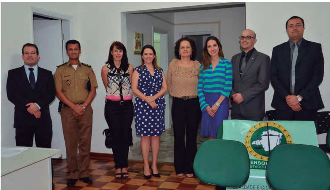
Reunião com os defensores da Regional Sul de Minas, em Pouso Alegre