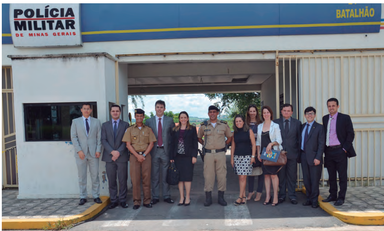
Visita da DPG ao comando do 24º BPM de Varginha, acompanhada de assessores, defensores públicos em atuação na comarca, em Boa Esperança e Alfenas

A defensora-geral também visitou as sedes dos comandos em Pouso Alegre e Poços de Caldas.