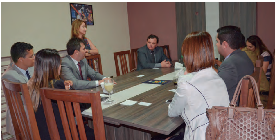
Reunião com os defensores da Regional Circuito das Águas, em Varginha

DPG reúne-se com defensores das regionais Sul de Minas, Alto Rio Pardo e Circuito das Águas