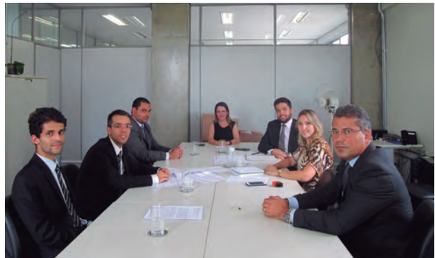
DPG reúne-se com defensores em atuação em Ipatinga