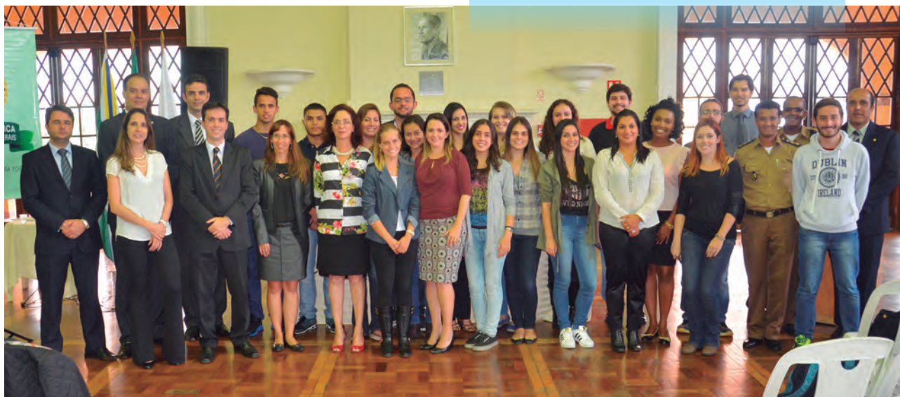
Participantes da capacitação sobre o novo CPC em Poços de Caldas

Os palestrantes abordaram especificidades do novo CPC, que entrará em vigor a partir do dia 17 de março, apresentando os principais avanços e retrocessos na nova redação do código.