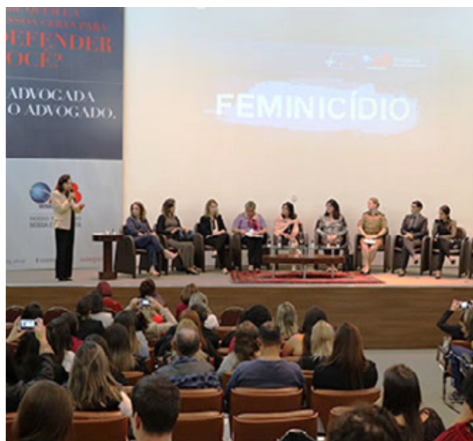
OAB Minas Gerais promove debate sobre feminicídio em BH