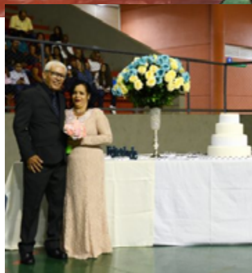
Marcha nupcial, troca de alianças e benção ecumênica em local com ornamentação especial, onde os noivos puderam eternizar o momento em fotos