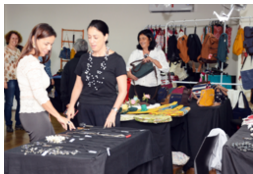
A maior parte dos produtos são criações próprias dos artesãos, com designers e funcionalidades exclusivas.

tesãos em procedimentos que vão desde produção até a comercialização. Hoje é uma instituição de alcance nacional e internacional.