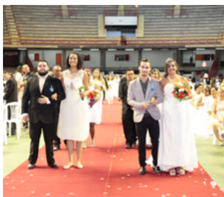
Celebração contou com tapete vermelho, ornamentação especial, marcha nupcial, troca de alianças e bênção ecumênica