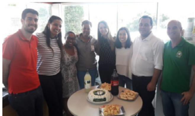
Foi servido um bolo, feito por uma assistida, decorado especialmente para a ocasião com o logotipo da DPMG

O “Café com os Assistidos” na sede de Brumadinho, aconteceu no dia 24 de maio, e foi organizado pelo Núcleo Estratégico para Proteção de Vulneráveis em Situação de Risco da DPMG, em atuação no município, para marcar o Dia da Defensoria Pública. Participaram da confraternização pessoas atingidas pelo rompimento da barragem que buscaram atendimento na Defensoria Pública do Estado em Brumadinho. A ação buscou mais uma vez a aproximação entre a Instituição e a comunidade de Brumadinho, além da valorização do trabalho que tem sido realizado desde o dia do rompimento da barragem.