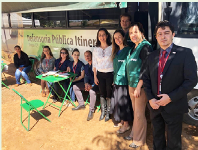
Defensores públicos e agentes da Ouvidoria Especializada do Sistema Penitenciário, em inspeção às unidades prisionais de São Joaquim de Bicas

A primeira ação com os objetivos propostos no termo de cooperação técnica firmado entre a Defensoria de Minas e a Ouvidoria-Geral do Estado aconteceu no dia 7 de junho, com a presença da Ouvidoria Móvel e da Defensoria Pública Itinerante em São Joaquim de Bicas, na Região Metropolitana, ao lado da Penitenciária Jason Albergaria.