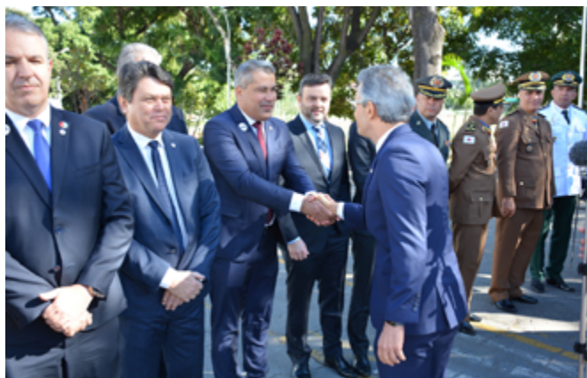
Governador de Minas Gerais, Romeu Zema, cumprimenta defensor público-geral do estado