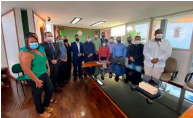
Assistidas e assistidos têm suas moradias regularizadas