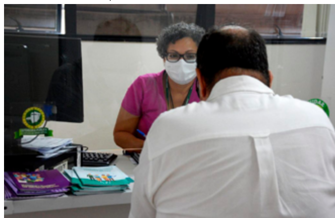
Núcleo Psicossocial da DPMG acolhe, atende e encaminha demandas das pessoas assistidas