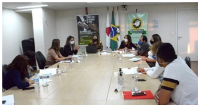
A reunião aconteceu na Sede I da DPMG, em Belo Horizonte