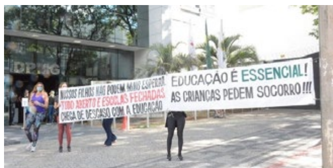
Pais de alunos cobraram soluções na porta da Defensoria Pública