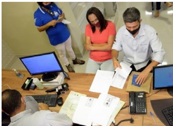
Casal entrega os documentos para a habilitação para o casamento no Cartório de Registro Civil do 4º Subdistrito de Belo Horizonte