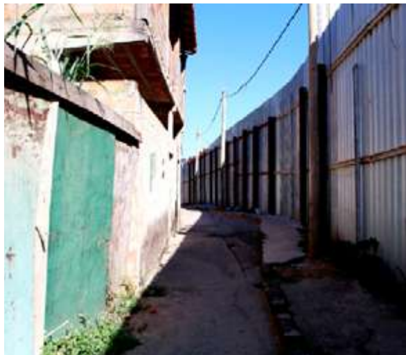
Vila Arthur de Sá, localidade das obras da Via 710

Por meio da assinatura de Termo de Ajustamento de Conduta (TAC), a Defensoria Pública de Minas Gerais (DPMG), junto com outras instituições, garantiu o reassentamento das famílias da Vila Arthur de Sá, em Belo Horizonte, em decorrência de obras da Prefeitura. O acordo foi assinado também por representantes da Defensoria Pública da União, Ministério Público Federal e Prefeitura do município.