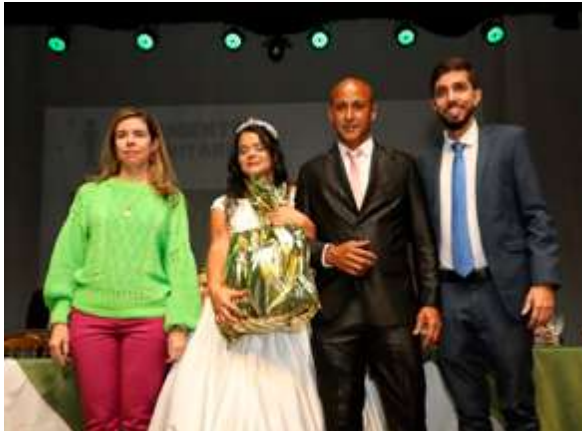
Concluída a cerimônia comunitária e entrega das certidões de casamento, os noivos foram convidados a participar de um sorteio