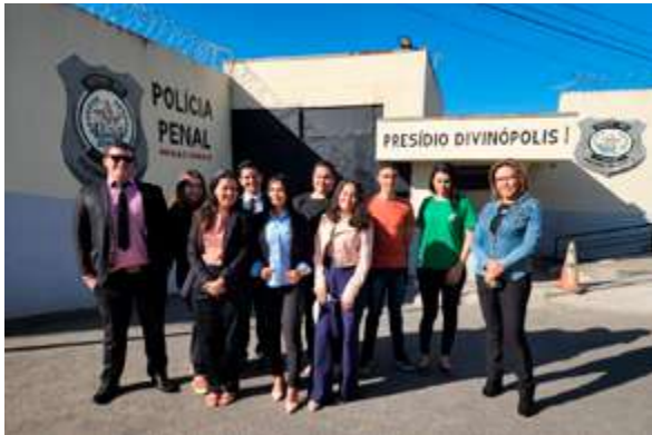
Quatro defensoras e defensores e seis estagiárias e estagiários da DPMG participaram do Mutirão no Presídio de Divinópolis I – Floramar

A Defensoria Pública de Minas Gerais (DPMG), em parceria com a Secretaria de Estado de Justiça e Segurança Pública (Sejusp), promoveu entre os dias 25 e 26 de julho um mutirão de atendimento aos detentos e detentas do Presídio de Divinópolis I – Floramar, localizado na região Centro-Oeste do