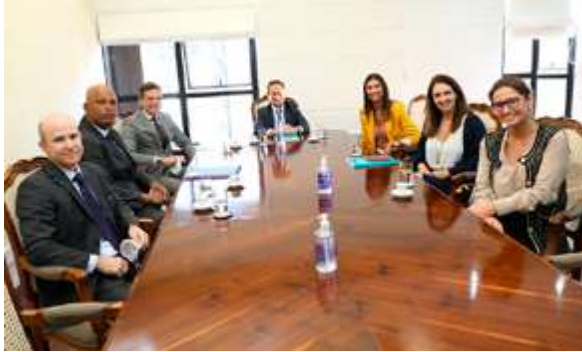
A reunião aconteceu na Corregedoria-Geral