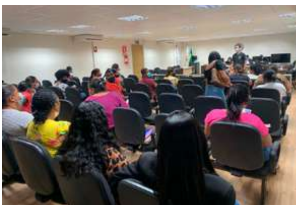
As pessoas interessadas em fazer o acordo receberam orientação da DPMG