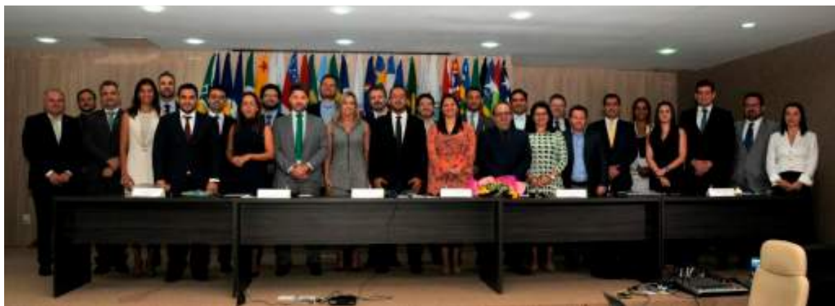
Defensoras e defensores públicos-gerais na 63ª reunião do Condege, realizada em Palmas (TO)