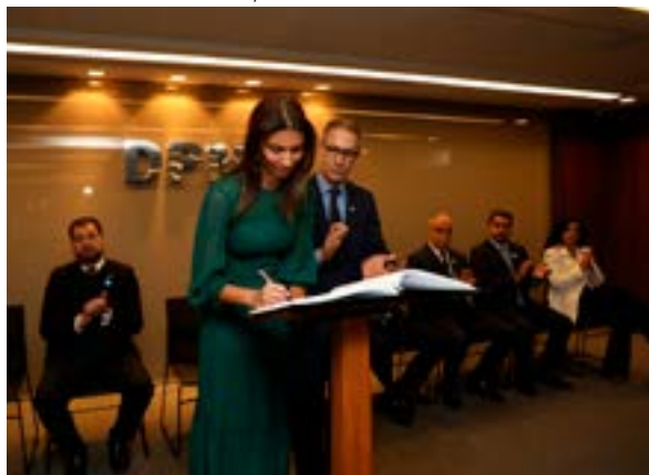
A nova defensora-geral de Minas e o governador assinam o livro de posse