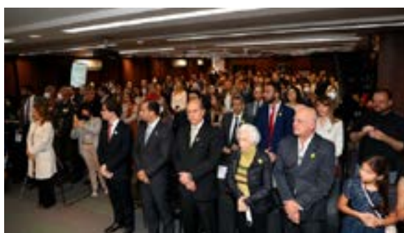
Diversas autoridades e alguns familiares prestigiaram a solenidade de posse da nova defensora pública-geral do Estado, no auditório da sede I da DPMG