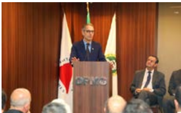
Governador de Minas Gerais, Romeu Zema: “A Defensoria Pública tem essa nobreza, desde a sua fundação”