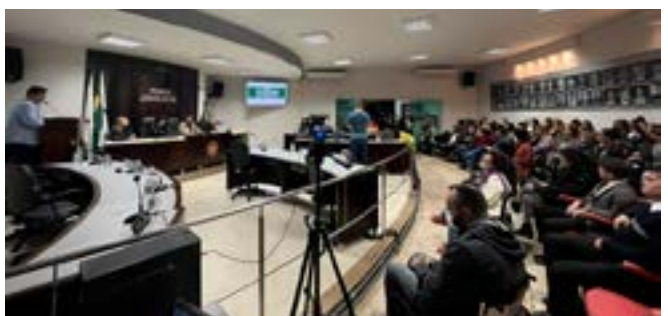
Defensoras públicas com autoridades e representantes locais durante o evento, realizado no plenário da Câmara Municipal