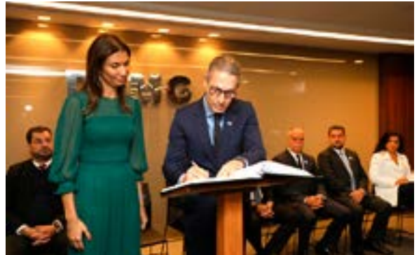
A nova defensora-geral de Minas e o governador assinam o livro de posse