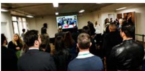
As solenidades de posse e entrada em exercício puderam ser acompanhadas ao vivo, em transmissão pelo YouTube

"Entregamos com alegria uma gestão que buscou a cada dia fazer o seu melhor", disse o agora ex-defensor-geral