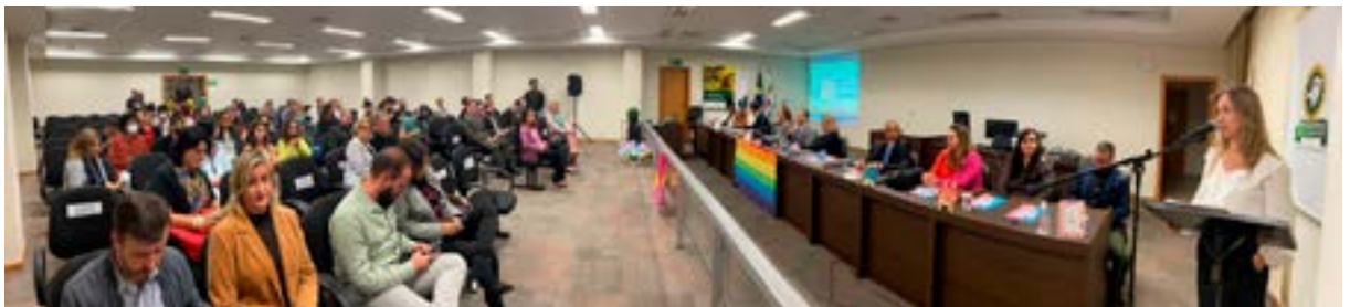
Em Uberlândia, evento foi prestigiado por autoridades e representantes de instituições de vários setores