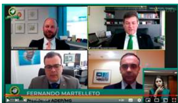
Painel “Acesso à Justiça: Natureza e Desdobramento na Ordem Nacional e Internacional” encerrou as atividades da Semana da Defensoria Pública