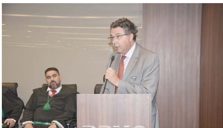
Secretário de Estado de Planejamento e Gestão, Helvécio Magalhães