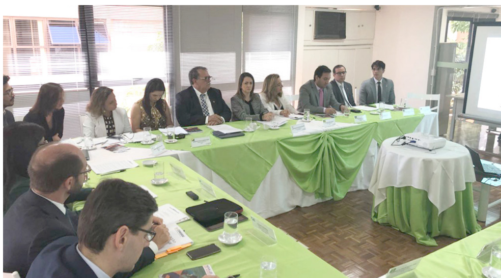
O Núcleo de representação em Brasília das Defensorias Públicas de Minas Gerais e da Bahia sediou o encontro

Desenvolvido pelo Tribunal Regional Federal da 4ª Região (TRF4), o SEI é uma ferramenta de gestão de documentos e processos eletrônicos, e tem como objetivo promover a eficiência administrativa. O SEI integra o Processo Eletrônico Nacional (PEN), uma iniciativa conjunta de órgãos e entidades de diversas esferas da administração pública, com o intuito de construir uma infraestrutura pública de processos e documentos administrativos eletrônico.