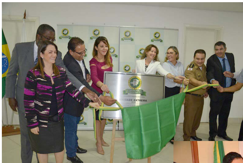
Descerramento da placa de inauguração em Extrema

A defensora-geral manifestou sua alegria em estar na comarca, afirmando que “não poderia terminar seu mandato sem ir à Extrema. Nos últimos quatro anos, inauguramos e estruturamos quase 60 unidades em todo o interior do Estado e é com muito carinho que hoje estamos aqui inaugurando esta sede, que significa mais acesso à Justiça para a população