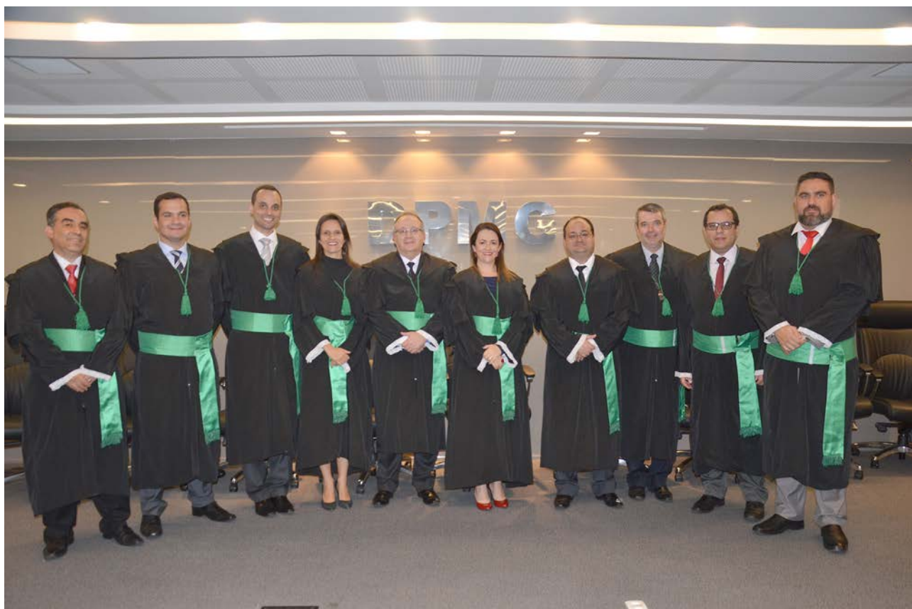
Conselho Superior da DPMG