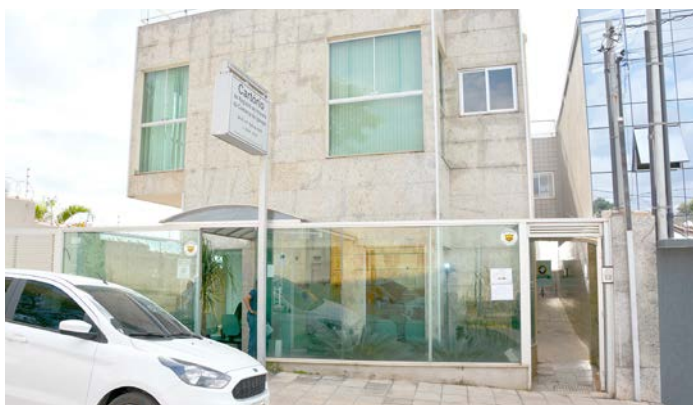
Fachada da unidade da DPMG em Igarapé