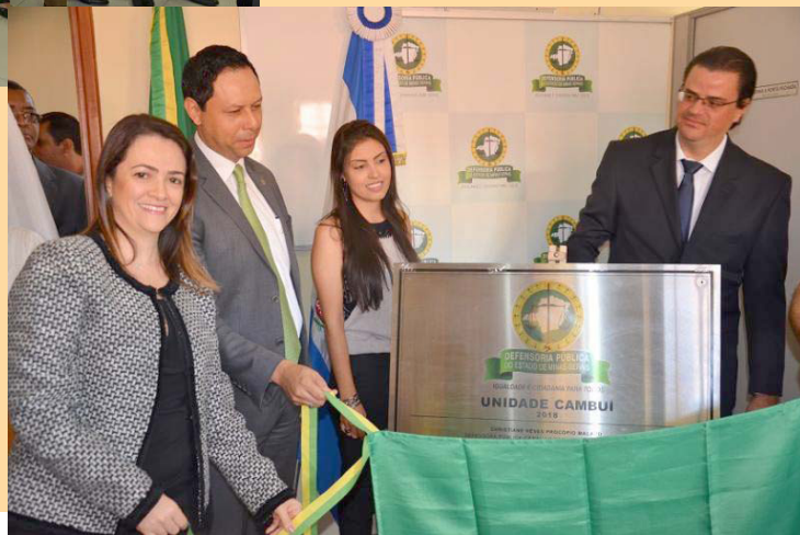
DPG e demais autoridades descerram a placa de inauguração da unidade de Cambuí