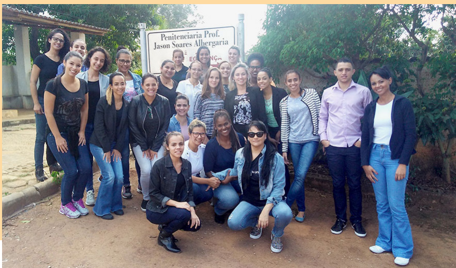
Estagiários em capacitação na penitenciária Jason Albergaria