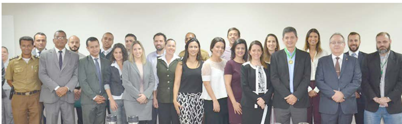
A homenagem contou com a presença de defensores públicos e servidores da DPMG