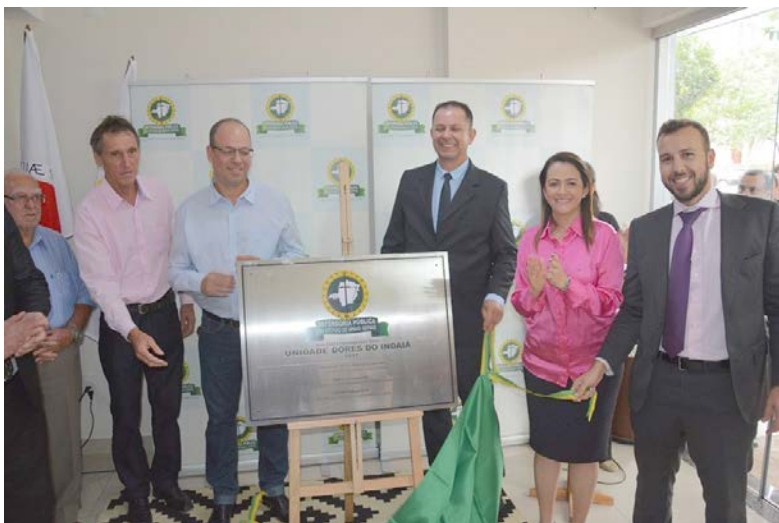
Descerramento da placa de inauguração

DPMG inaugura quatro novas instalações na região Centro-Oeste do Estado e no Triângulo Mineiro