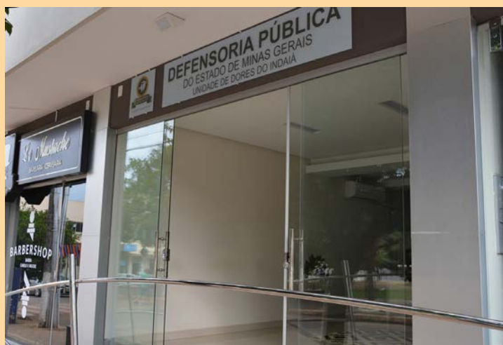
Fachada da sede em Dolores do Indaiá