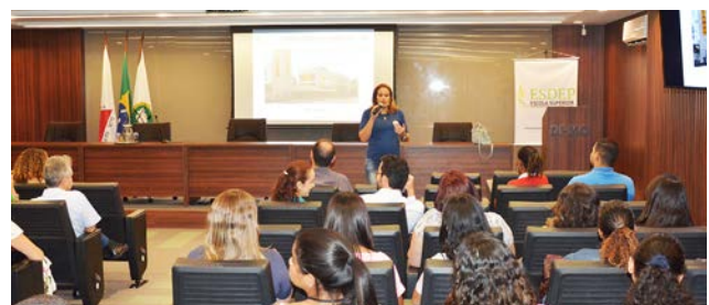
As profissionais explicaram o funcionamento do Samu e em quais situações acionar o Corpo de Bombeiros, a PM ou o Samu.

As enfermeiras ensinaram a diferenciar síndrome convulsiva e síndrome conversiva e abordaram, ainda, diabetes e hipoglicemia.