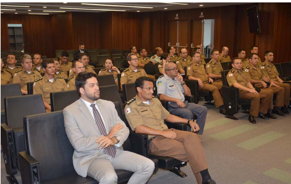
Oficiais em visita à DPMG