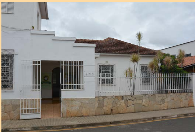
Unidade de Patrocínio