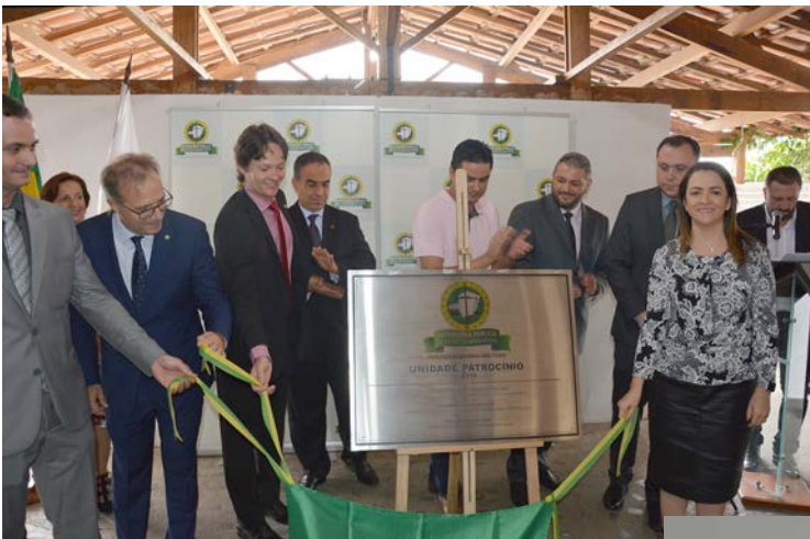
DPG e demais autoridades descerram a placa de inauguração