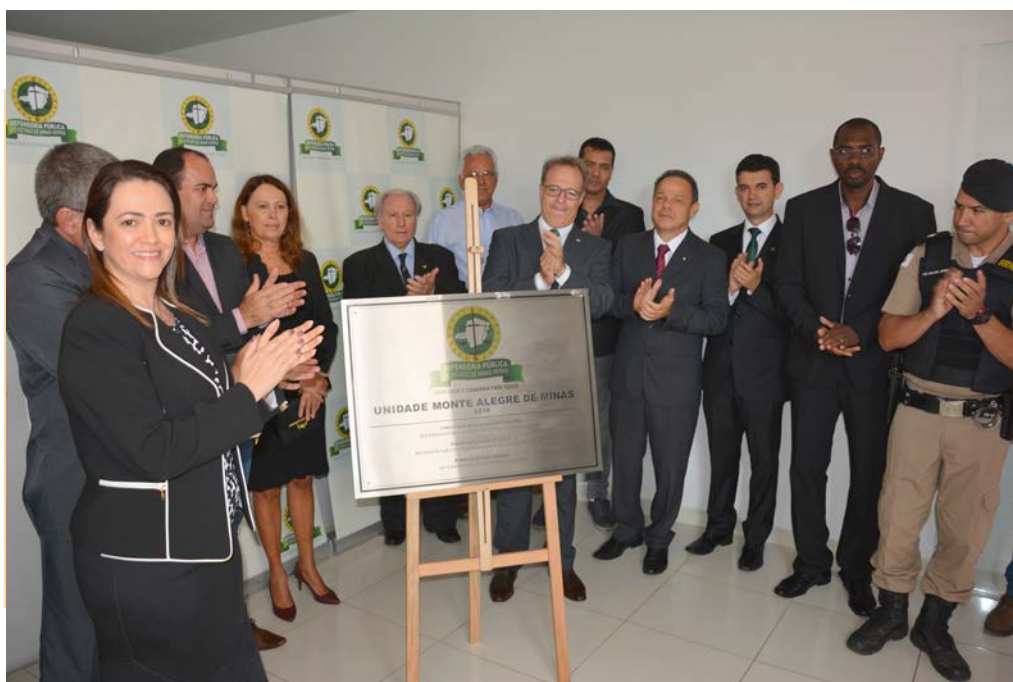
Descerramento da placa de inauguração