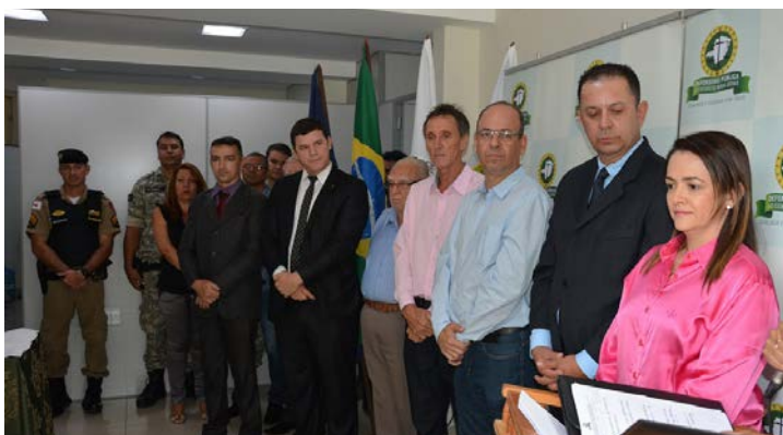
Dispositivo de autoridades