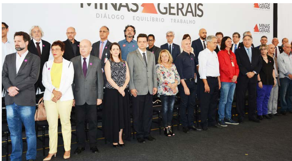
A defensora pública-geral, Christiane Malard (4ª posição da esquerda para a direita, primeira fila)

Tombado pelos patrimônios municipal e estadual, todas as propostas de intervenção física no edifício serão desenvolvidas segundo as diretrizes estabelecidas pelos órgãos municipal e estadual de proteção ao patrimônio. Do mesmo modo, a definição dos temas e modos de abordar os diferentes assuntos será desenvolvida a partir de um minucioso levantamento histórico, baseado em pesquisas documentais, em depoimentos das vítimas e em debates com representantes de políticas de reparação simbólica.