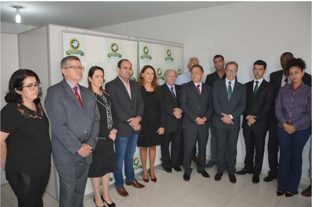
Dispositivo de autoridades