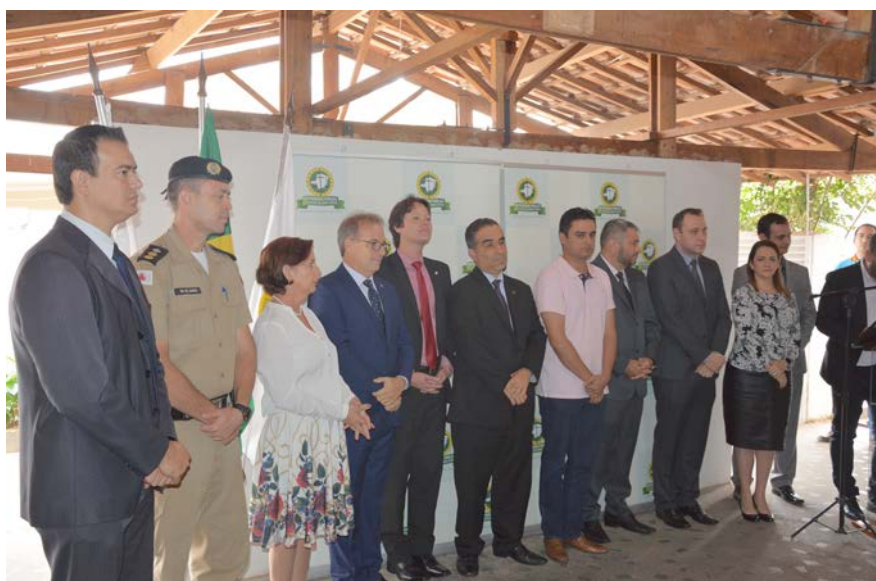
Dispositivo de autoridades