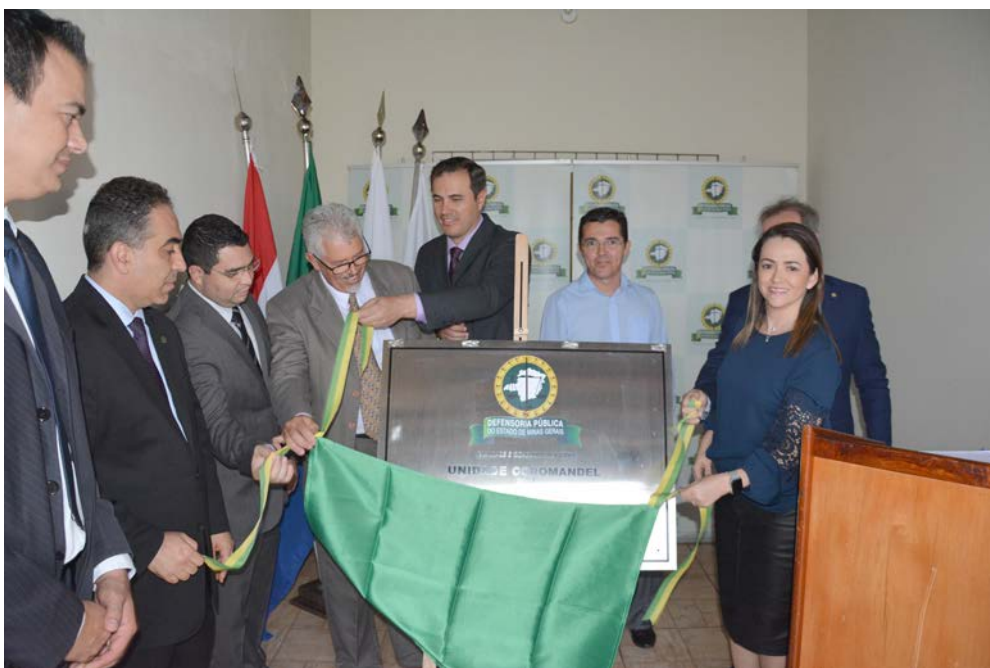
Descerramento da placa de inauguração