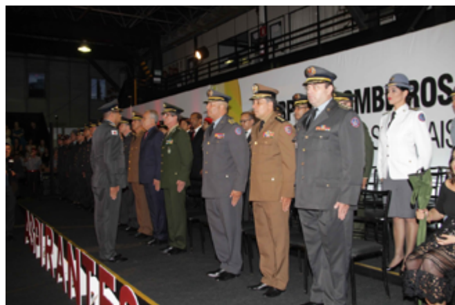
Cerimônia de formatura do Curso de Formação de Oficiais – Aspirantes 2018