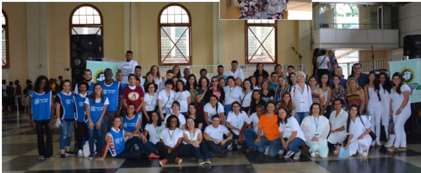
Equipe de trabalho voluntária que proporcionou a realização do II Dia Mundial dos Pobre em Belo Horizonte