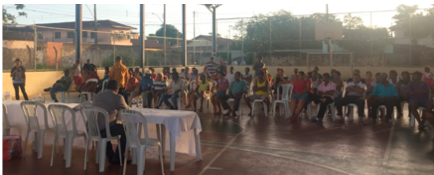
Reunião realizada no distrito de Baixa Verde, em Dionísio