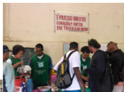
Distribuição de lanche aos assistidos. Abaixo, defensoras públicas da comarca acompanhadas de estagiários e funcionários

Ao todo, foram realizados 22 atendimentos pela DPMG, em várias áreas, incluído criminal e família. Na ocasião, foram distribuídas roupas, café da manhã, almoço, lanches, recreação infantil, música ao vivo, palestras, cortes de cabelo e aferição de pressão arterial.