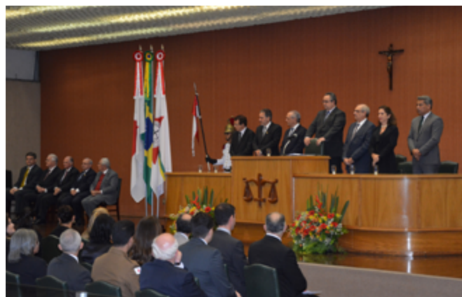
Autoridades durante a abertura da solenidade

A cerimônia acontece no dia 27 de novembro em homenagem ao nascimento de Teófilo Ottoni.