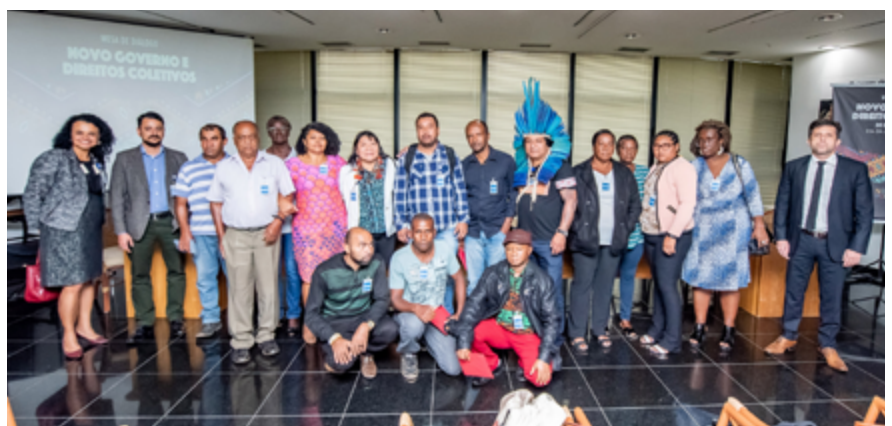
Representantes e autoridades envolvidas na mesa de diálogo