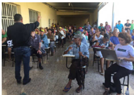
Audiência em Revés do Belém, distrito de Bom Jesus do Galho