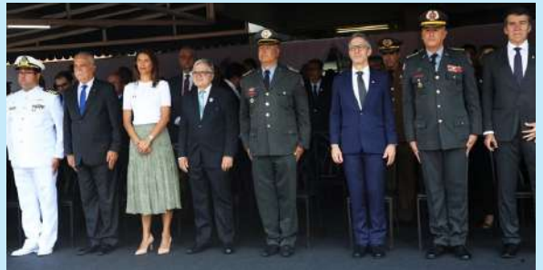
Solenidade de troca de comando no Corpo de Bombeiros

No dia 31 a defensora pública-geral participou também da solenidade de passagem de Comando-Geral do Corpo de Bombeiros Militar de Minas Gerais, quando o coronel BM Erlon Dias do Nascimento Botelho foi empossado pelo governador Romeu Zema como o novo comandante-geral da corporação. O evento ocorreu na Academia de Bombeiros Militar, no Complexo Pampulha.