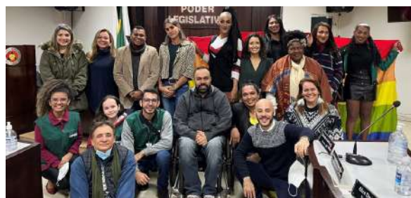
Mutirão realizado pela Defensoria Pública de Minas Gerais na unidade de Ituiutaba