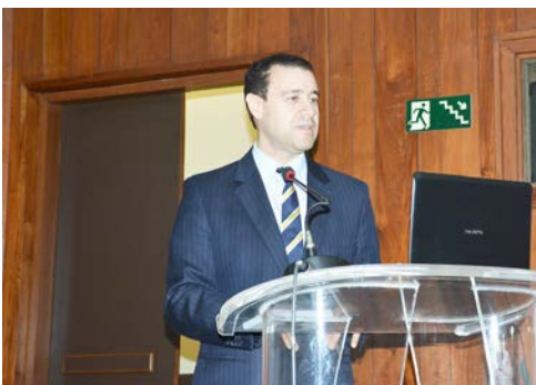
Ministro do Superior Tribunal de Justiça, Nefi Cordeiro, em palestra na inauguração da Esdep. 17/03/2017

Após um ano de criação, a Esdep promoveu 63 capacitações voltadas para defensores públicos, servidores, assistidos, estagiários, comunidade jurídica e sociedade civil em geral. Desse total, foram realizadas 19 atividades gratuitas de educação em direitos que beneficiaram assistidos da Instituição. Para capacitação interna, foram promovidos 44 cursos, seminários e palestras, com participação de 1.741 defensores e servidores.