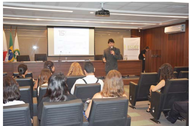
O evento contou com a participação do chefe de Gabinete; assessores da Defensoria-Geral; defensores públicos e servidores