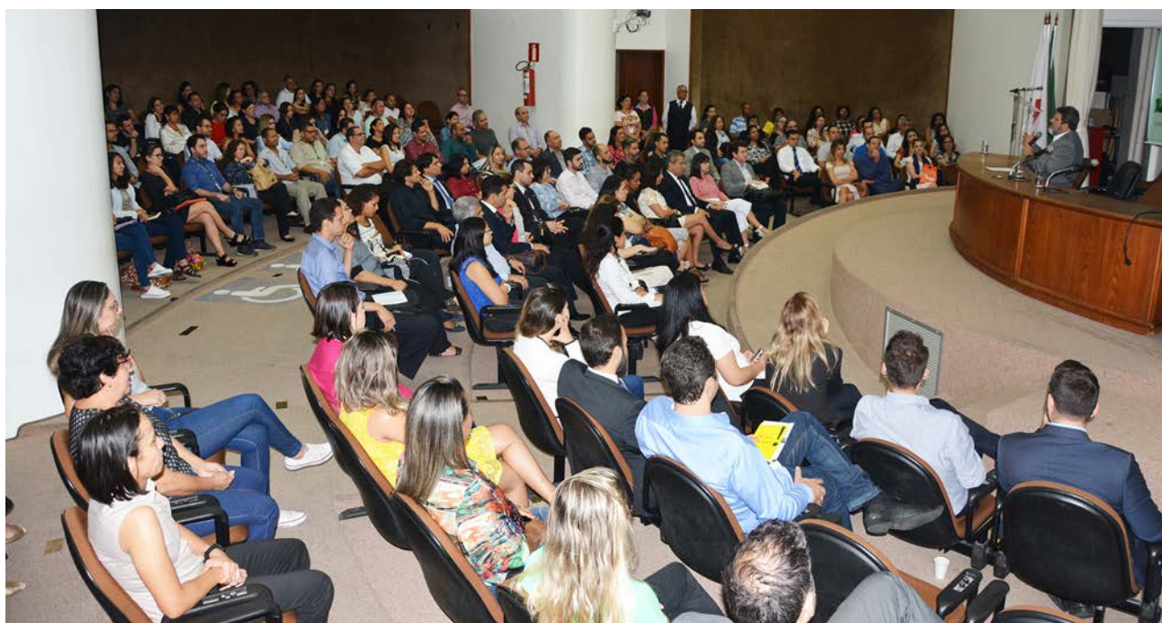
Palestra com o filósofo Mario Sergio Cortella

A Escola também incentiva e apoia iniciativas de defensores públicos do interior para realização de encontros, seminários e atividades do gênero, buscando padronizar os eventos de capacitação da DPMG, com inscrições pelo site da Esdep, certificação e apoio para presença de palestrantes.