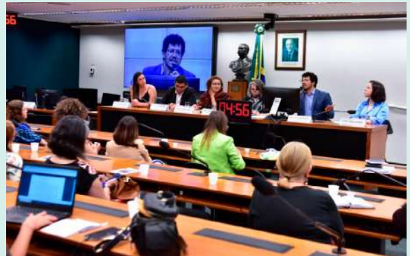
Comissão de Legislação Participativa da Câmara dos Deputados abordou os resultados positivos do projeto Defensoras Populares