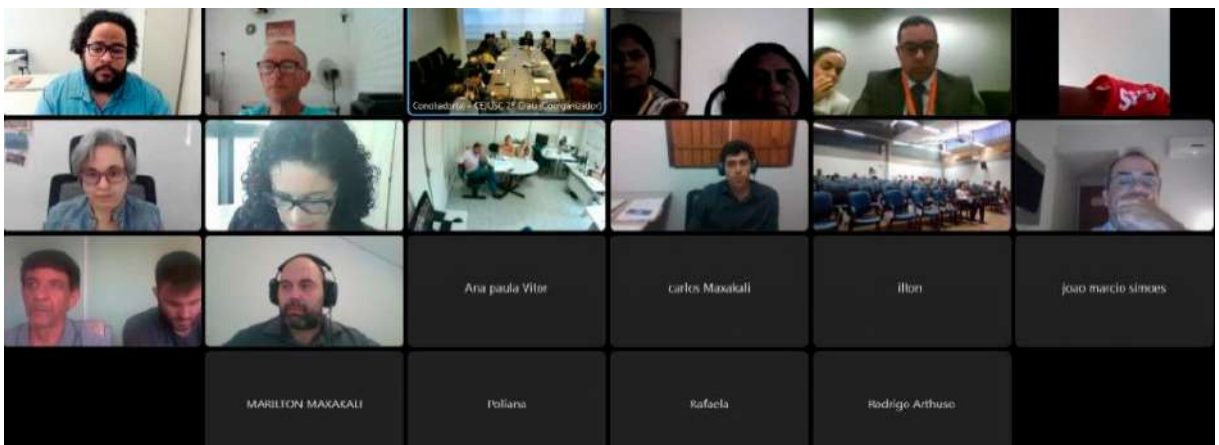
Reunião resultou em encaminhamentos às autoridades competentes mais informações sobre a situação de saúde dos indígenas