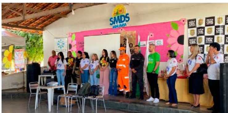
Evento teve participação da DPMG em parceria com outras instituições