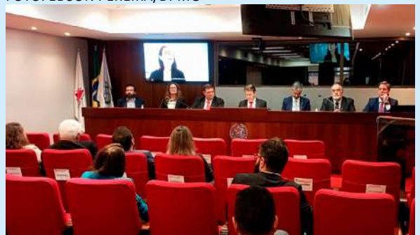
Evento aconteceu no Ministério Público de Minas Gerais